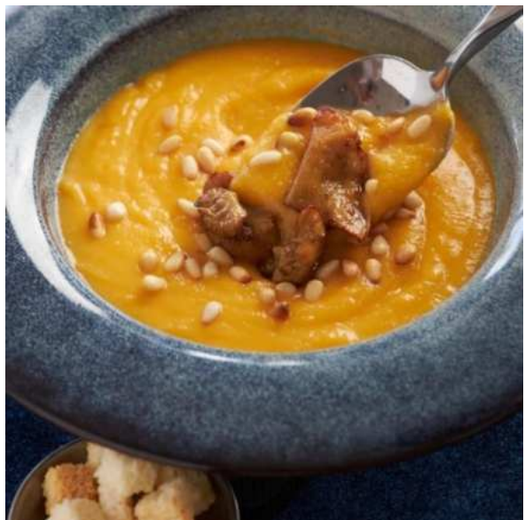
Тыквенный крем-суп с белыми грибами и кедровыми орехами. 250 г