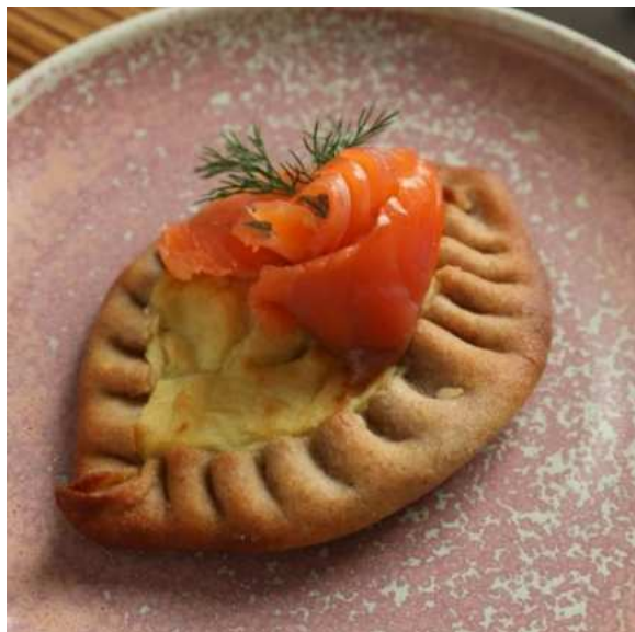
Ржаная калитка с форелью и картофелем.