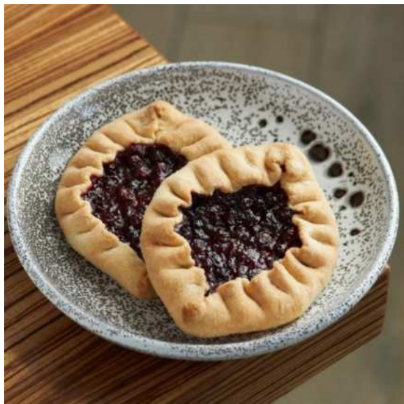
Калитка с брусникой.