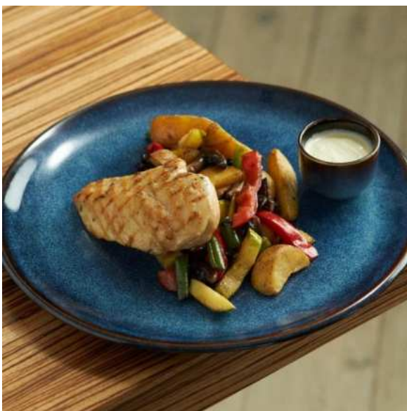
Куриная грудка, обжаренная на гриле с овощами, стручковой фасолью и горчичным соусом. 360 г