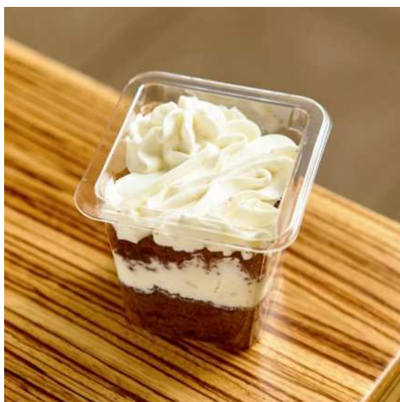
Шоколадный трайфл с черникой. 130 г