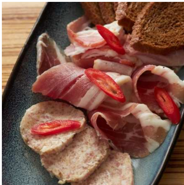
Солодовый багет с тремя видами сала: сало солёное, кручёное с чесноком, бекон. 60/20 г