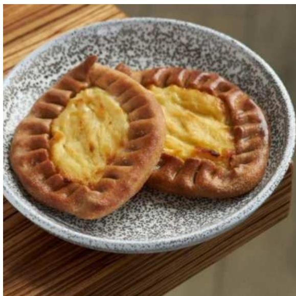
Ржаная калитка с картофелем.