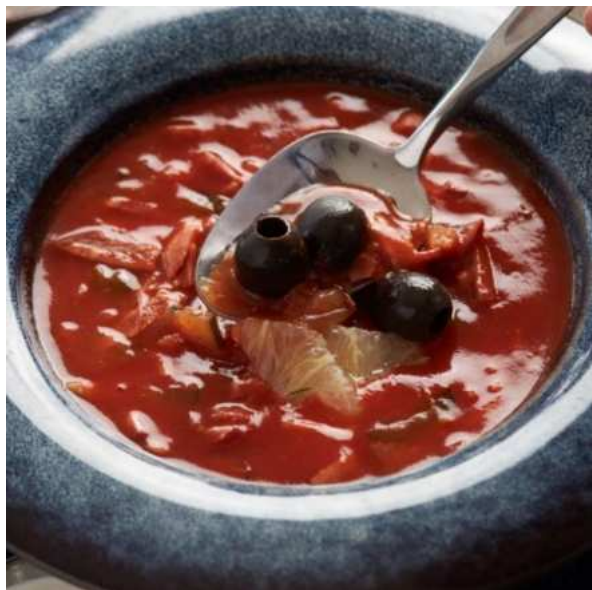
Солянка на бульоне из копчёных рёбер, с бужениной, говядиной, свининой и сметаной. 250 г