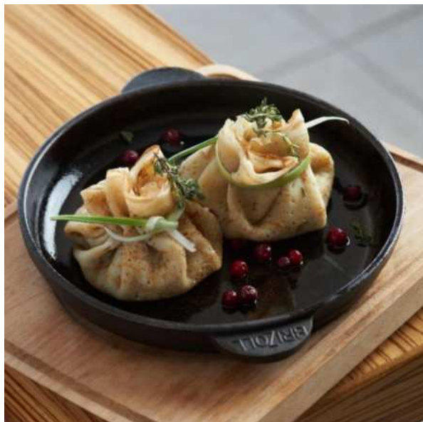
Блинчики с грибным жульеном и луком-пореем. 200 г