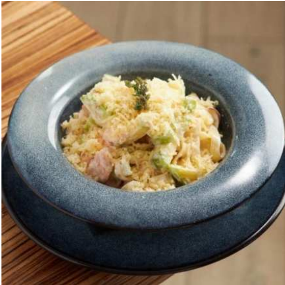
Фетучини с форелью и цукини. 290 г