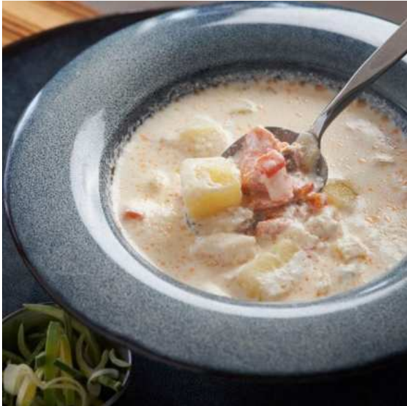
Сливочная уха с форелью с луком-пореем и судаком. 250 г