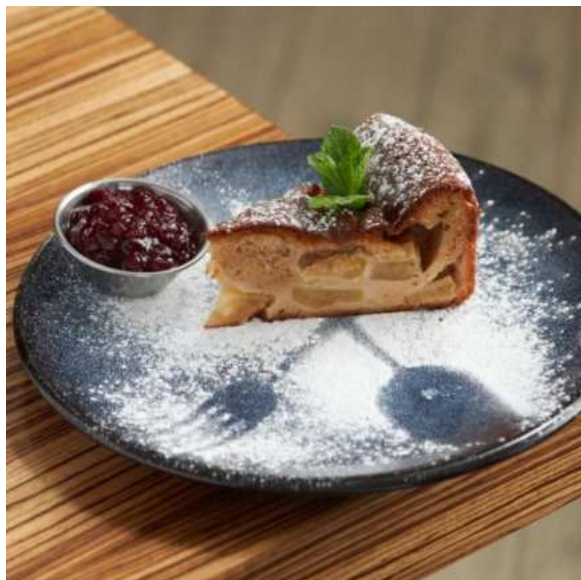
Шарлотка с брусничным соусом. 150 г