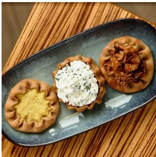
Трио закусочных калиток с картофелем и лисичками, с творогом, с пшеном. 40 г*3 шт.