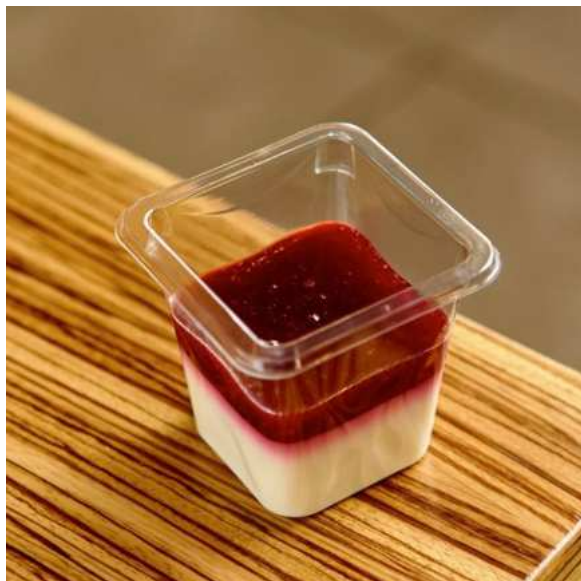
Панна котта с карельской брусникой. 150 г