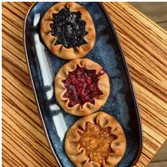
Трио десертных калиток с морошкой, черникой и брусникой 40 г*3 шт.