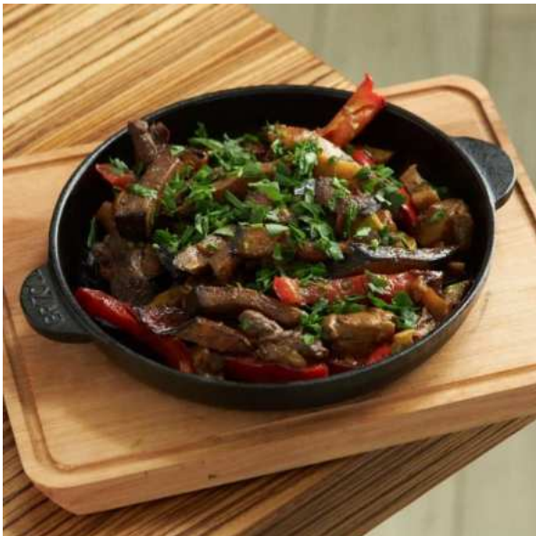
Жаркое из оленины с белыми грибами и печёными овощами. 190 г