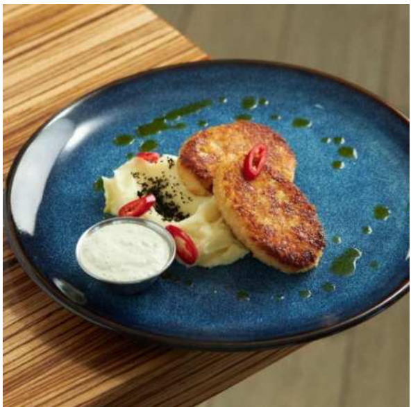
Котлеты из щуки с картофельным пюре и соусом тар-тар. 260 г