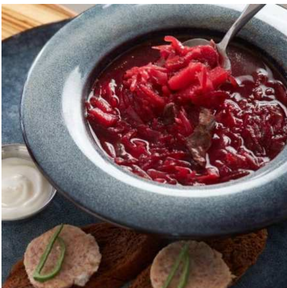
Борщ с подкопчённой олениной и салом с чесноком. 250 г