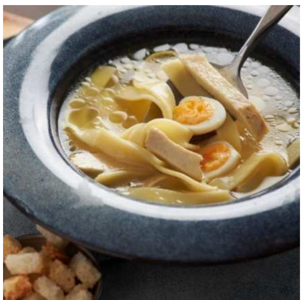
Куриный бульон с домашней лапшой перепелиным яйцом и хрустящими гренками. 250 г