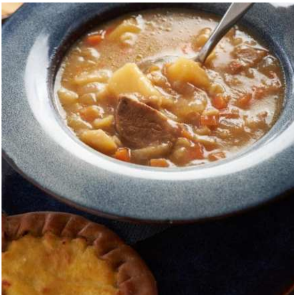
Грибница с перловкой и картофельной калиткой на основе белых грибов. 250 г