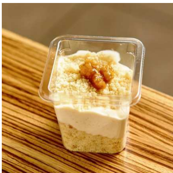
Чизкейк с морошкой. 120 г