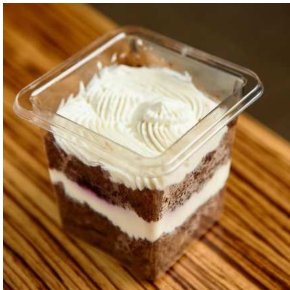
Морковный трайфл с брусникой. 130 г