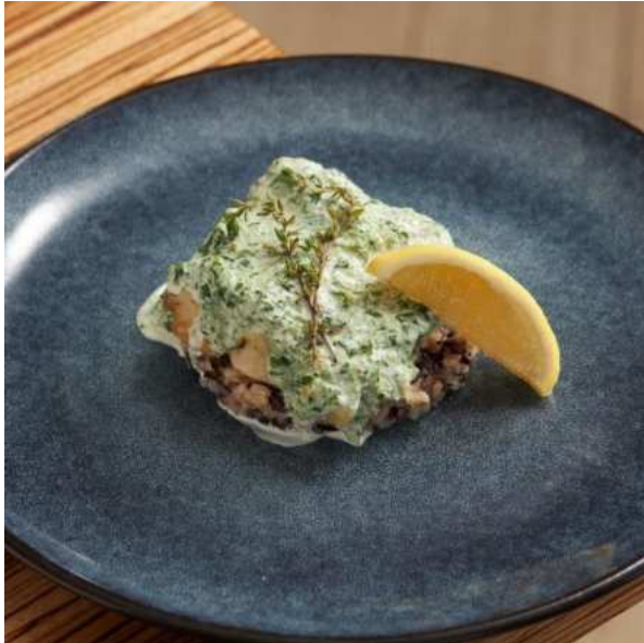
Лойн беломорской трески с бурым рисом и сливочным соусом. 230 г