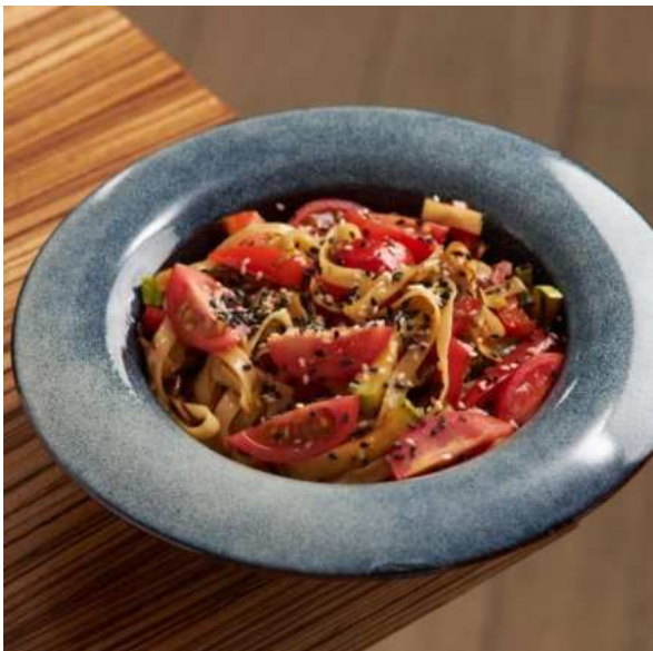
Паста с молодыми овощами и кунжутно-соевым соусом. 200 г