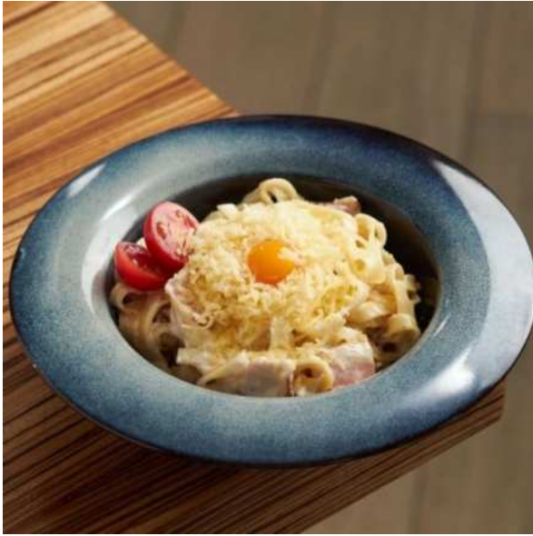
Тальятелле карбонара с копчёной грудинкой и пармезаном. 280 г