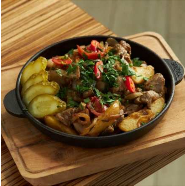
Жаркое из свинины с белыми грибами, картофелем и маринованными огурцами. 350 г