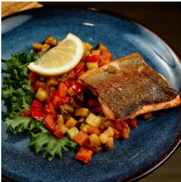
Филе форели с запечёнными овощами и вялеными томатами. 215 г